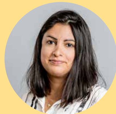
Nooshi Dadgostar valdes 2020 till Vänsterpartiets partiledare.

Vårt feministiska arbete är inte bara löften, teorier och tomt prat. Vår feminism handlar om att gå från ord till handling. Det är därför vi är den viktigaste feministiska kraften i Alingsås, Västra Götaland och Sverige.