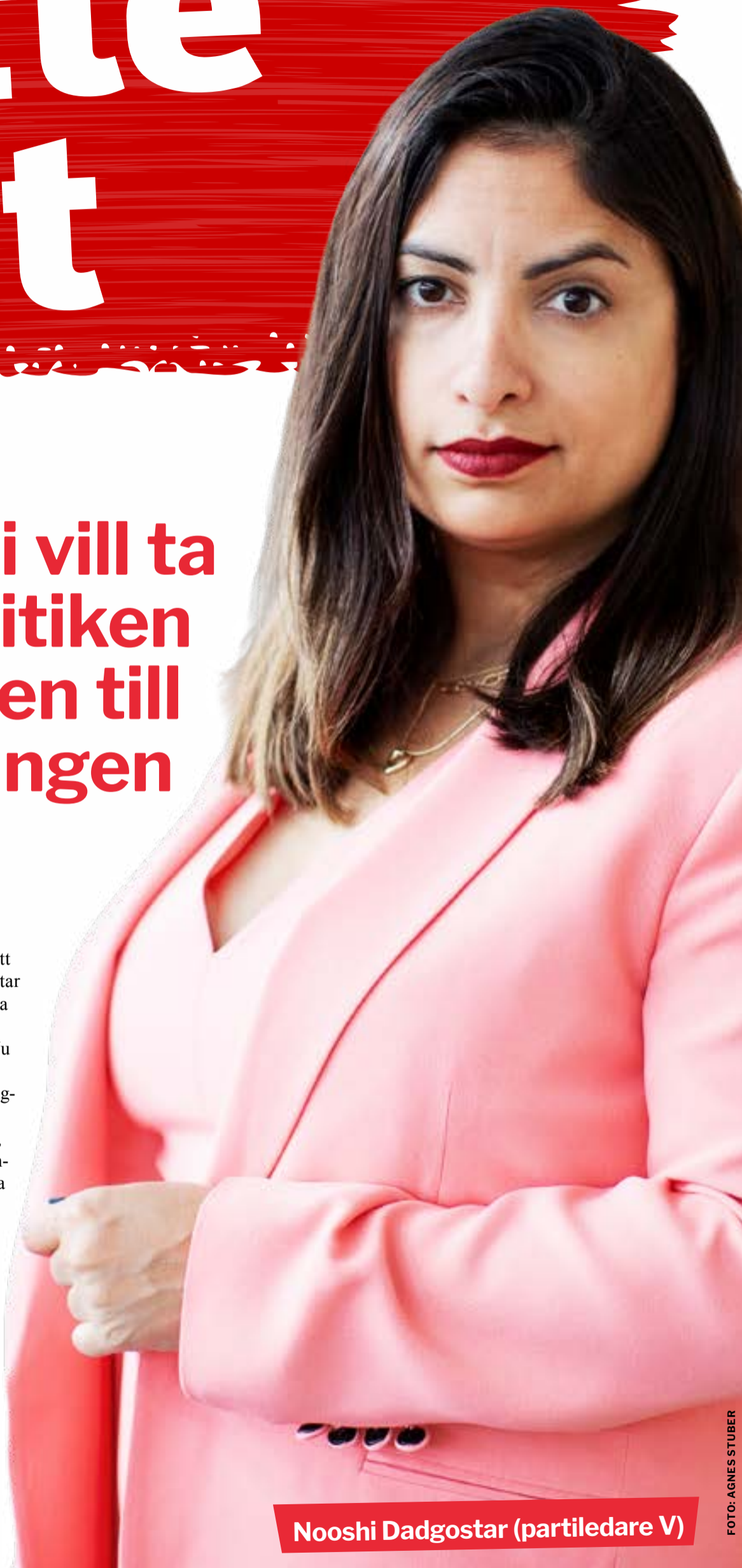
Nooshi Dadgostar (partiledare V)